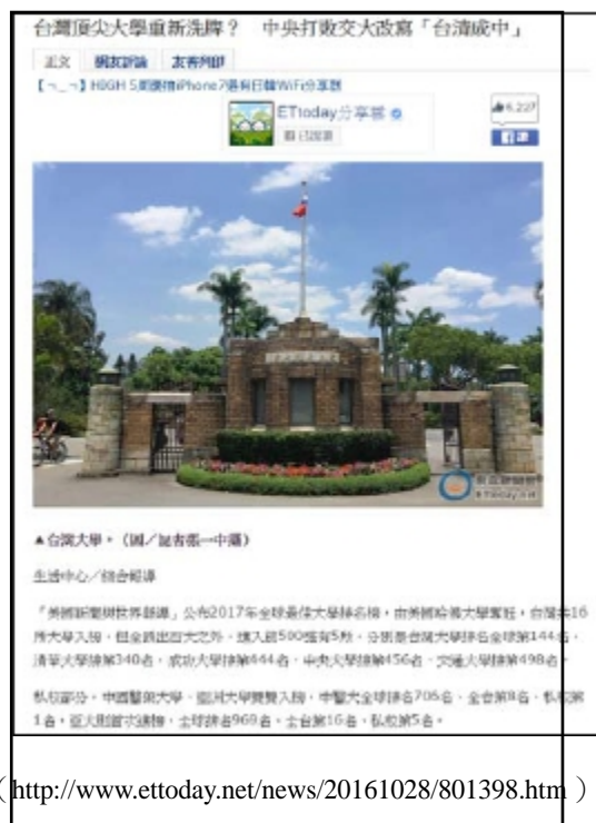
( http://www.ettoday.net/news/20161028/801398.htm )

說到世界大學排名，媒體年年關注，只要一有新排名出來，平面及電視媒體，無不廣泛報導！