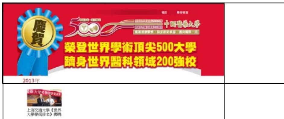
( http://www.cmu.edu.tw/top500/ )

除了媒體，臺灣各大專院校對此更是念茲在茲！例如中國醫藥大學，就在自己的學校網站上，慶賀名列世界學術頂尖 500 大，及世界醫科領域 200 強！